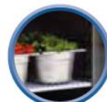
Grilles sur glissières