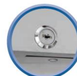
Serrure de porte