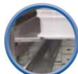
Kit 600x400 en option