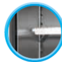
Grilles sur taquets (4 taquets par grille)