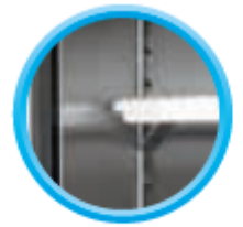
Grilles sur taquets (4 taquets par grille)