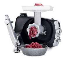
hachoir à viande