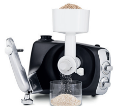
moulin à café / farine