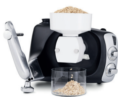
moulin à céréales