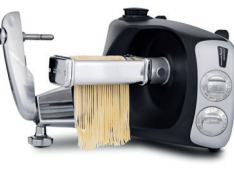
rouleau à spaghetti