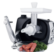
embouts à saucisses