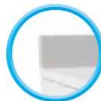
Dossier H 100 mm