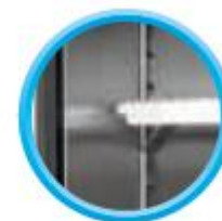
Grilles sur taquets (4 taquets par grille)