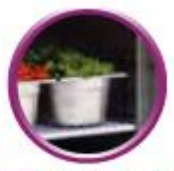
Grilles sur glissières